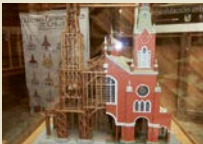
Chiloé Island Naturparadies und Heimat von über 150 Stabkirchen.