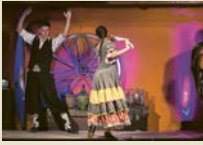
Buenos Aires Wiege des Tangos.