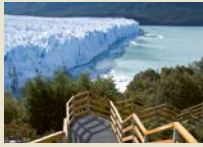
Perito Moreno Der Gletscher gehört zu den schönsten Sehenswürdigkeiten in Südamerika.