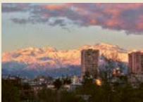
Santiago de Chile Kultureller Schmelztiegel mit einer reichen Geschichte.