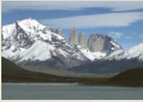
Torres del Paine Nationalpark Drei markante Granitfelsen, die dem Park seinen Namen geben.