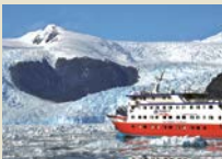
MS Skorprios III Max. 100 Passagiere - familiäre Atmosphäre garantiert.